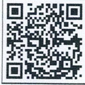
Alljobs QR code